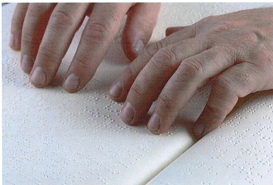
Branje brajice z blazinicami prstov