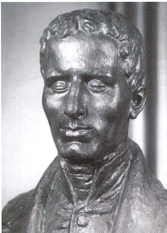
Doprni kip - Louis Braille